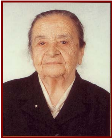
Φιλιά Χαϊδεμένου, γενν. 1899

Η κυρία Φιλιά Χαϊδεμένου, η γνωστή από τις τηλεοπτικές αφηγήσεις της, από τη βράβεισή της στην Ακαδημία Αθηνών και από το Μικρασιατικό Μουσείο που ίδρυσε και διευθύνει στη Νέα Φιλαδέλφεια, η γιαγιά από τα Βουρλά, που έζησε σε τρεις αιώνες, εξέδωσε τις μαγνητοφωνημένες αφηγήσεις της σε βιβλίο με τίτλο « Τρεις αιώνες μια ζωή », (Εκδόσεις Λιβάνη).