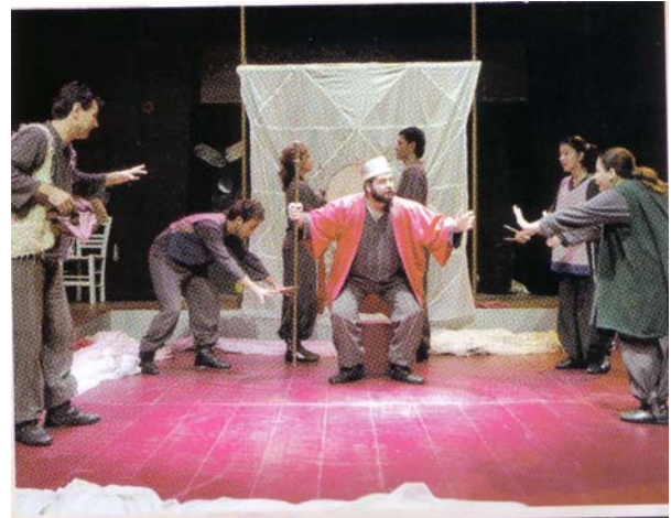
Από την παράσταση στο «Αττικό Θέατρο»

«Οι Έλληνες φαίνεται ότι ποτέ δεν υπήρξαν πρωτόγονοι κι ακόμα και στους λαϊκούς τους μύθους φανερώνουν χαρίσματα μιας βαθύτερης καλλιέργειας, που και σήμερα ο έκπληκτος ταξιδιώτης τη βρίσκει στη μακρινή