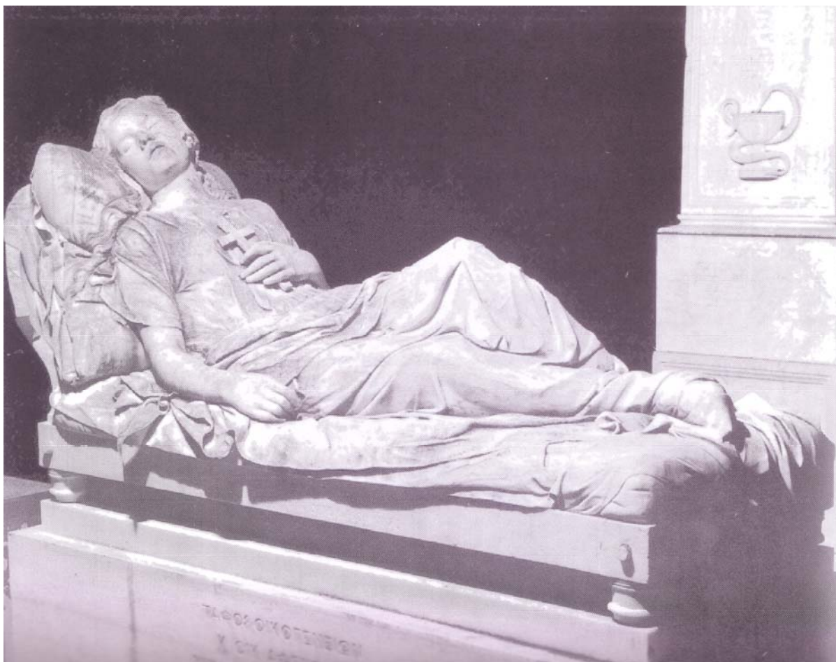
Γιαννούλη Χαλεπά, Η Κοιμωμένη , 1878, Α΄ Νεκροταφείο Αθηνών (Παρουσίαση του βιβλίου του Χρήστου Σαμουηλίδη «Γιαννούλης Χαλεπάς, η τραγική ζωή του μεγάλου καλλιτέχνη» στις σελίδες 2-4)