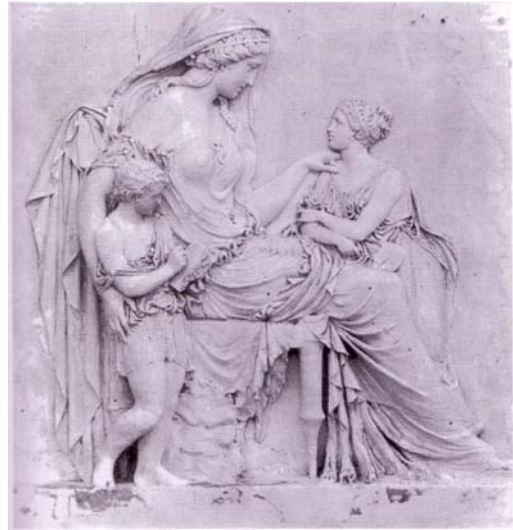
Γιαννούλη Χαλεπά, Φιλοστοργία , 1875 Τήνος, Μουσείο Τηνίων Καλλιτεχνών (Ίδρυμα Ευαγγελιστρίας Τήνου)