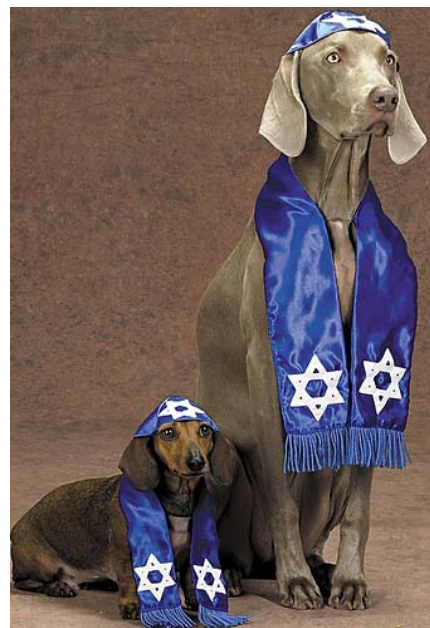
Εβραίος στη συναγωγή; ↓