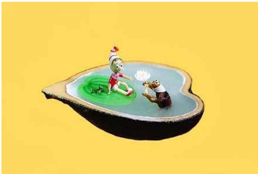
Σε σπόρο σταφυλιού