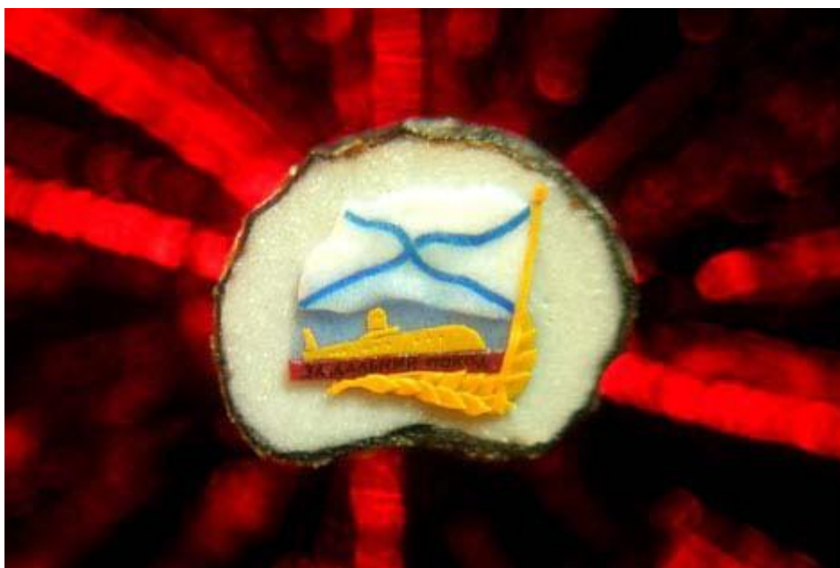
Σε σπόρο παπαρούνας