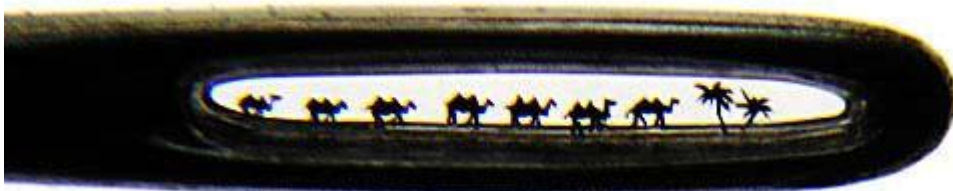
Στο μάτι ενός βελονιού