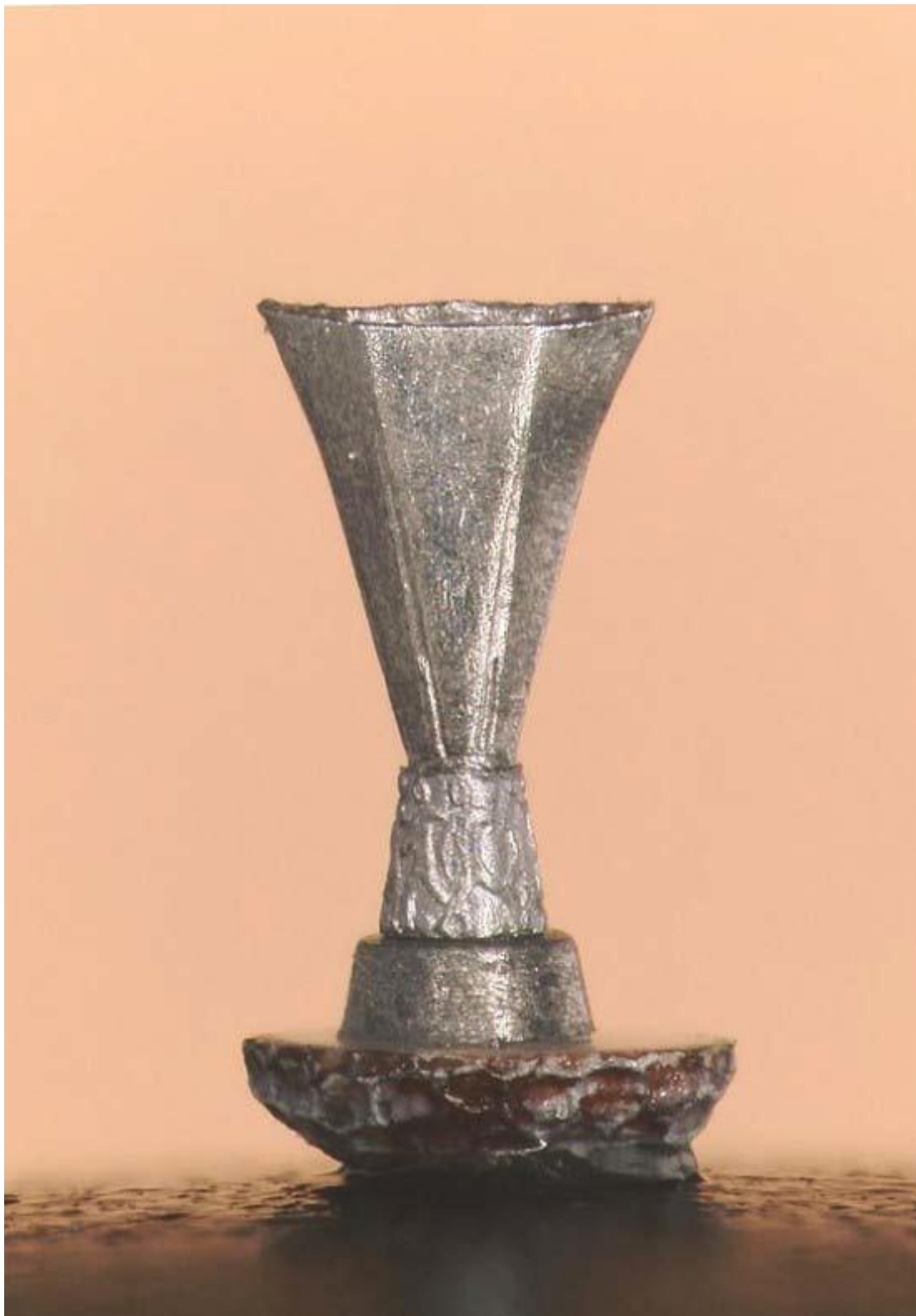
Σε σπόρο παπαρούνας