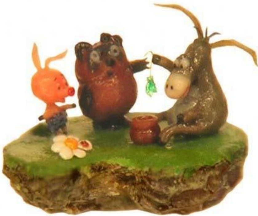
Σε σπόρο παπαρούνας