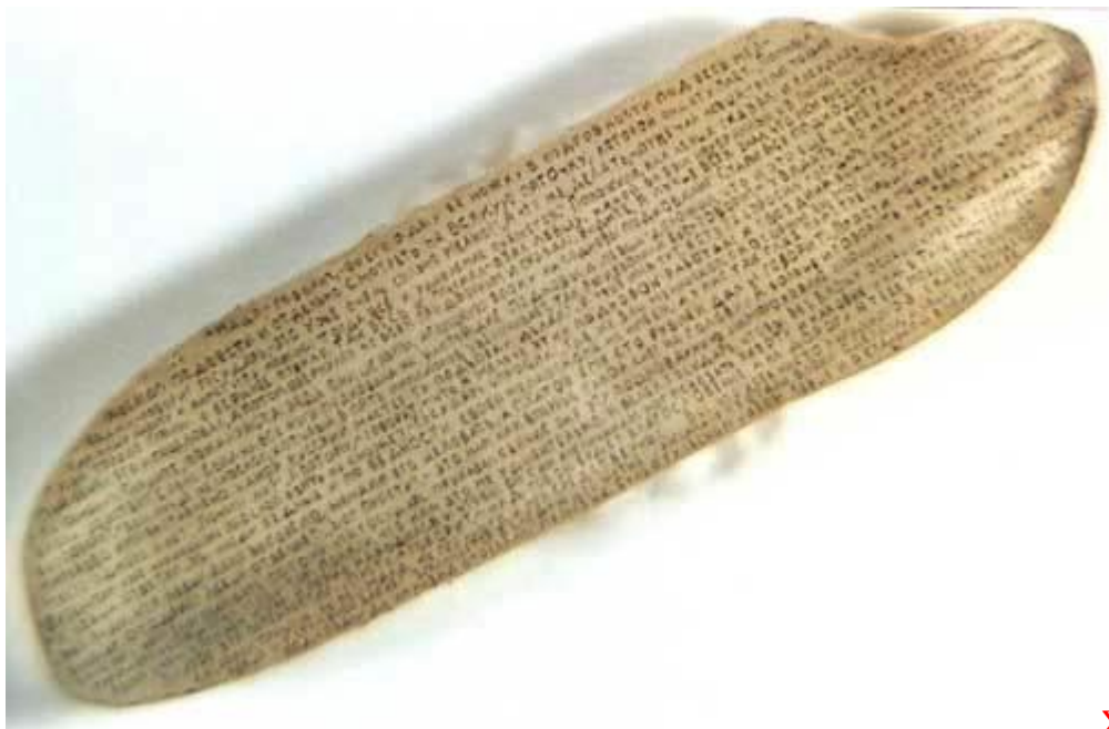
Σε κόκκο ρυζιού